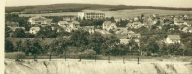
Horní Bříza - pohled od zastávky (pohlednice - vydal Orbis počátkem padesátých let)

Uhelných dolů bylo šest: Barbara, Václav, Marie, Johann Nepomucký, Konrád a Theresia. Nepříliš kvalitní uhlí bylo v malé hloubce pod povrchem a těžilo se ručně šachtíčkami. Za první světové války byl o uhlí značný zájem a prodávalo se místním občanům netříděné. Pracovalo tu 12-28 lidí, denně se těžilo 30-50q. Těžba byla ukončena po první světové válce, ale udává se, že se uhlí krátce těžilo také během druhé světové války.