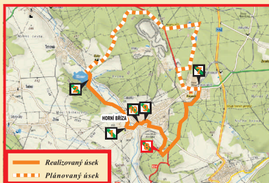
— Realizovaný úsek - - - Plánovaný úsek

Uhelných dolů bylo šest: Barbara, Václav, Marie, Johann Nepomucký, Konrád a Theresia. Nepříliš kvalitní uhlí bylo v malé hloubce pod povrchem a těžilo se ručně šachtíčkami. Za první světové války byl o uhlí značný zájem a prodávalo se místním občanům netříděné. Pracovalo tu 12-28 lidí, denně se těžilo 30-50q. Těžba byla ukončena po první světové válce, ale udává se, že se uhlí krátce těžilo také během druhé světové války.