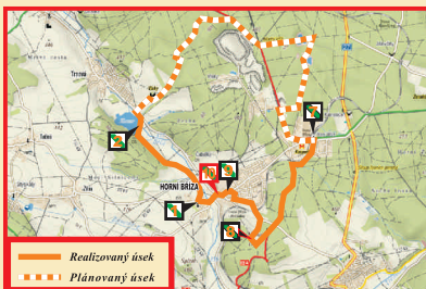
— Realizovaný úsek - - - Plánovaný úsek