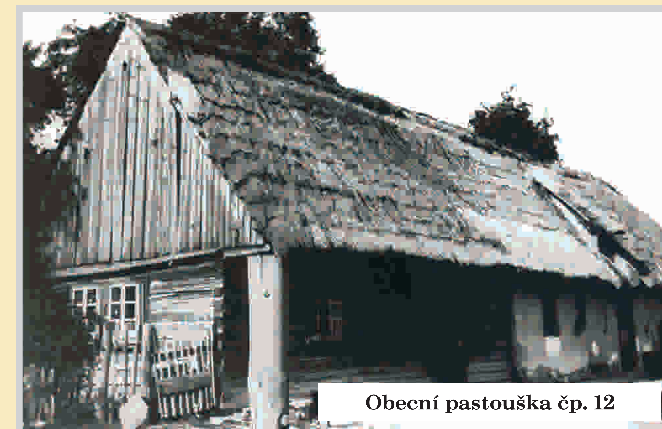
Obecní pastouška čp. 12